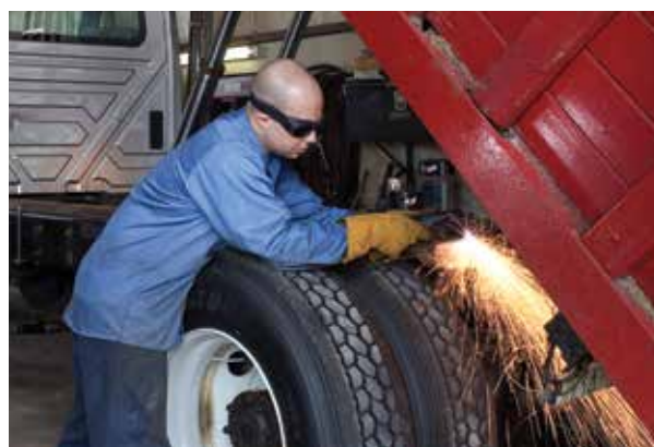
Voertuigreparatie en -aanpassing