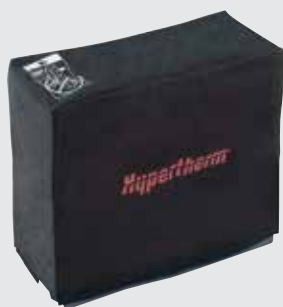
Stofkap voor het systeem